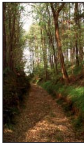
Il sentiero lungo il confine con il Comune di Cantù