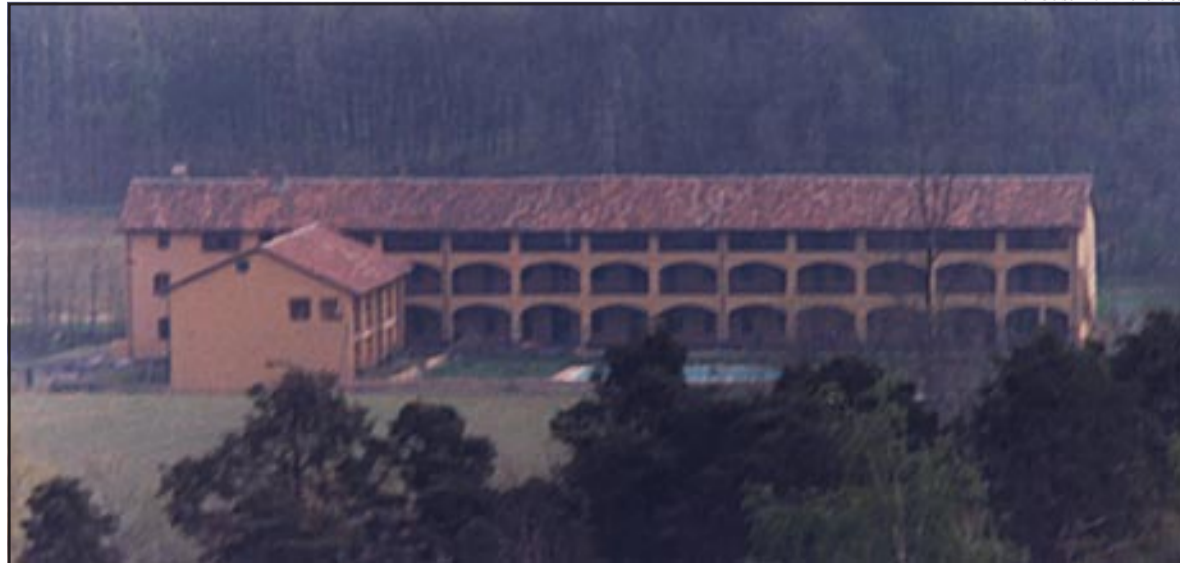
La Cascina Inviolata