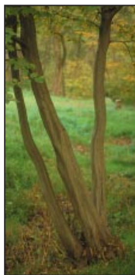
Il Carpino bianco