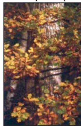
Farnia in abito autunnale