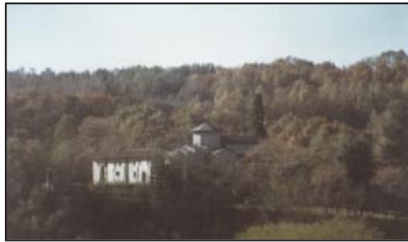
La valle del Seveso e l'abbazia di Vertemate

Le MORENE sono terreni fini, di colore marrone-giallastro, costituiti prevalentemente da limi, anche argillosi, nei quali sono immersi ciottoli, ghiaie e sabbie. I ciottoli, di dimensioni diverse, derivano da rocce cristalline (graniti, scisti...). Le morene, in forma di colline blande e sinuose, costituiscono l'ossatura del territorio comunale e derivano dall'accumulo dei materiali più vari erosi ed abrasati dalla massa glaciale nella sua discesa verso valle. I DEPOSITI GLACIO-LACUSTRI interessano prevalentemente l'area di Campagnazza, nella parte settentrionale del comune. Sono ciò che resta di piccoli bacini lacustri che si formavano alle spalle dei cordoni morenici principali. Anche oggi sono frequentemente sede di ristagni d'acqua (sorgente Gaggio e terreni circostanti). Sono costituiti da limi sabbiosi di color grigio-rossastro e localmente da argille grigio verdastre. Inglobano ciottoli e ghiaie prevalentemente cristallini. Il CEPPO è un conglomerato prevalentemente calcareo-dolomitico con scarsi elementi cristallini. È piuttosto massiccio, senza stratificazione, di colore grigiastro, con sottili intercalazioni sabbioso-arenacee. Nella zona della Cascina Bernardelli, lungo la scarpata della Valle del Seveso, è possibile osservare un esteso affioramento di queste rocce.