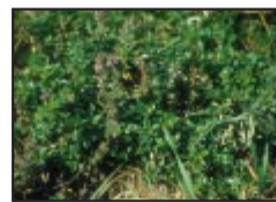
Timo in fiore