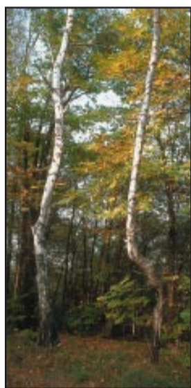
Bosco di brughiera